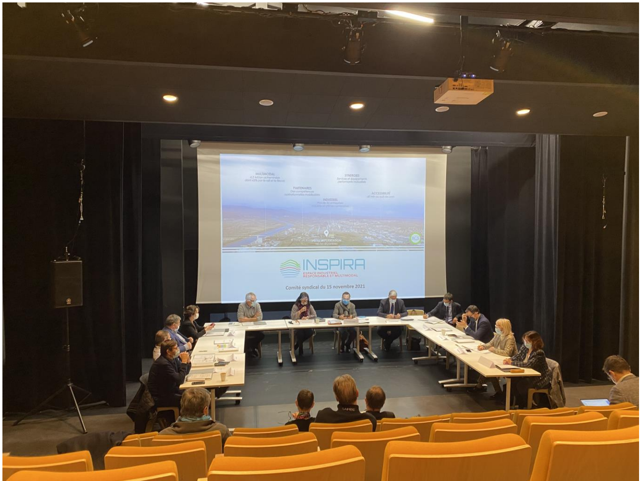
Comité Syndical du 15 novembre 2021