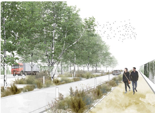
Requalification de la rue des Balmes