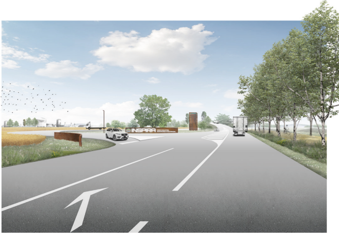
Nouvelle signalétique à l'entrée Nord d'INSPIRA le long de la RD51

Les travaux se concentreront sur l'aménagement et la requalification des espaces de la partie déjà urbanisée au nord du site. Les enjeux sont, d'une part la mise en valeur d'INSPIRA et des entreprises en place et d'autre part, l'accueil de nouvelles activités sur les terrains disponibles autour de la Maison de projet. Dans un premier temps, une nouvelle signalétique sera déclinée. Elle permettra de s'orienter vers les entreprises du site. Un nouveau relais information service sera installé, marqué par un totem monumental qui symbolisera la porte d'entrée d'INSPIRA le long de la RD51.