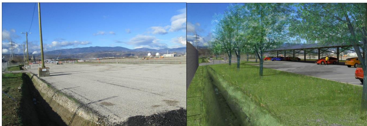
Parking mutualisé avant / après

La production d'électricité annuelle estimée est de 400 MWh, l'équivalent de la consommation électrique de 160 personnes. L'installation étant raccordée au réseau public, l'électricité ainsi produite permettra d'alimenter la maille locale en énergie renouvelable.